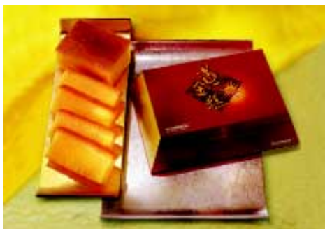
農曆新年黃金糕禮盒裝