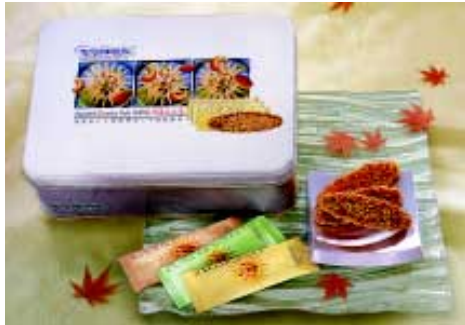
最新設計脆果片片禮盒裝