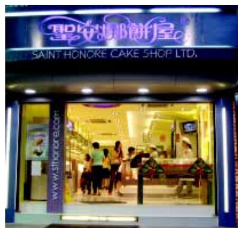
廣州東川最新店舖

儘管以規模較小的店舖取代旗下銷量最高的九龍灣分店，但由於龍翔道分店所座落的公共屋邨入住率不斷改善，而該店的銷售額更錄得雙倍增長，故麵飽廊仍能維持輕微的銷售增長2%。為豐富向客戶提供的產品種類，我們於過去數年分拆若干店舖，並於該等店舖增設「聖安娜餅店」。此項策略已見成效，分拆後整體銷量亦已提升，且可抵銷物料成本不斷上漲的部分影響。儘管我們於非典型肺炎期間獲得減租，然而，有關減省已大致為員工成本增加所抵銷。因此，整體業績亦減少約7%。